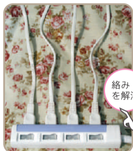
◎根元で髪の毛がからまって自由に動けない状態 ◎髪の毛のからまりが解消され自由に動ける状態